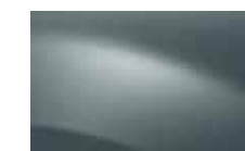
MODRÁ ELECTRIQUE RNZ (TE)