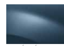
MODRÁ MINÉRAL RNF (TE)