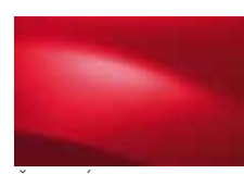
ČERVENÁ PASSION 21D (OV)