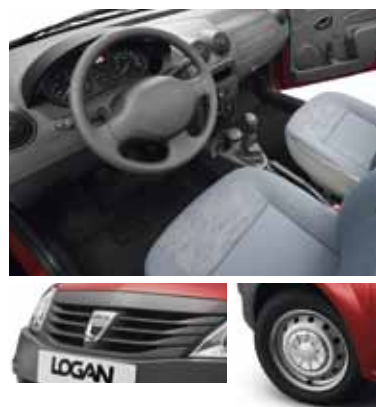
MOTORY 1.6 8V 62 kW/85 k