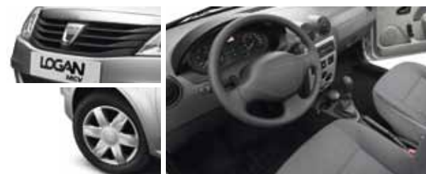
MOTORY 1.6 8V 62 kW/85 k 1.5 dCi 55 kW/75 k