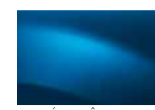
MODRÁ EXTRÉME RNA (TE)