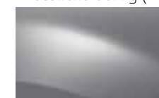
ŠEDÁ PLATINE D69 (TE)